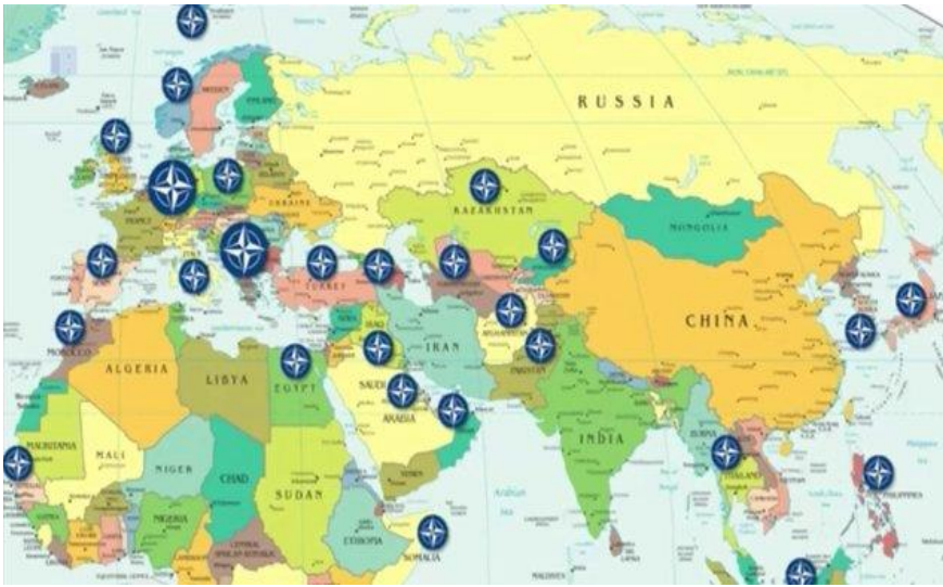
NATO Militärstützpunkte: Wer bedroht hier wen?

In einer Veröffentlichung des „Instituts der Europäischen Union für Sicherheitsfragen“, einer Denkfabrik der EU, heißt es dazu: „Es wird auch 2020 noch einige entfremdete Regime geben, wobei der Kreml den größten Unsicherheitsfaktor darstellt. Daher müssen wir uns die Fähigkeit bewahren, ihnen entgegenzutreten, wenn sie unser Weltbild vorsätzlich angreifen... Gegenüber den entfremdeten modernen Staaten muss die GSVP (Gemeinsame Sicherheits- und Verteidigungspolitik der EU) eine harte Machtpolitik verfolgen, die von Einflussnahme im Clausewitzschen Sinne bis zur direkten militärischen Konfrontation reichen kann.“ (Zitiert nach: „Die Militarisierung der EU“ von Claudia Haydt und Jürgen Wagner)